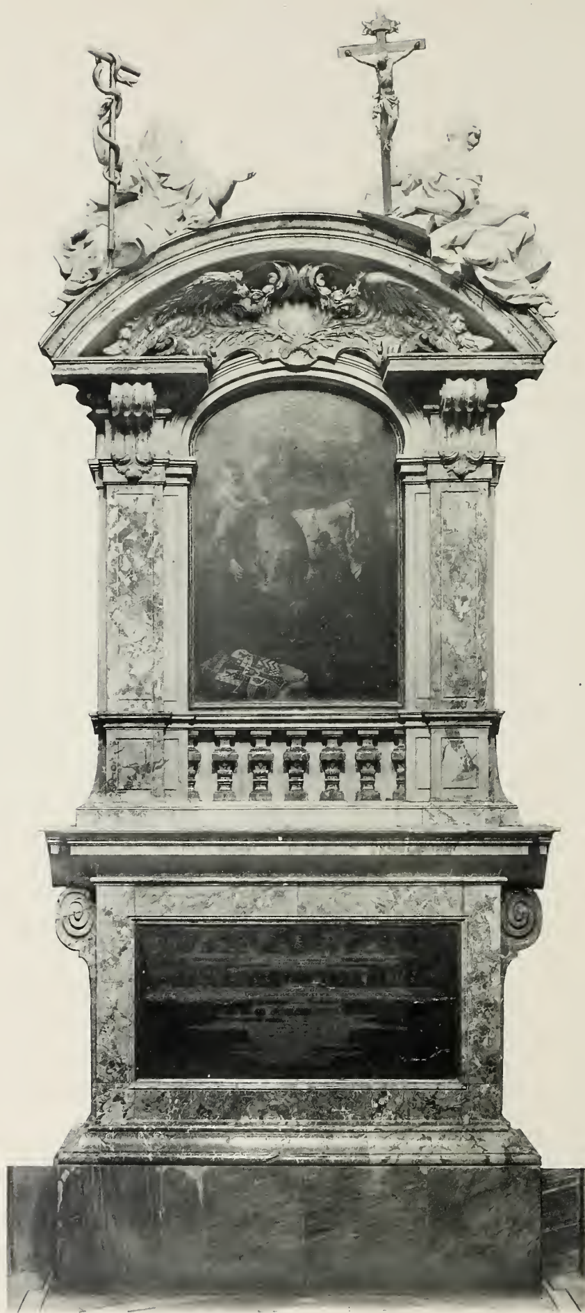
Franz Ludwig, Pfalzgraf bei Rhein.